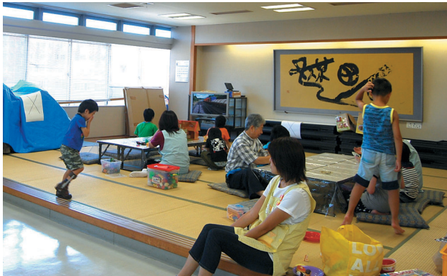
障がい児サロン“わんぱくらぶ”

〒243-0301 神奈川県愛甲郡愛川町角田257-1 福祉センター内 ☎ 046-285-2111(代) ☎ 046-286-5424 HP: http://www.shakyo-aikawa-kanagawa.jp e-mail: aishakyo@shakyo-aikawa-kanagawa.jp