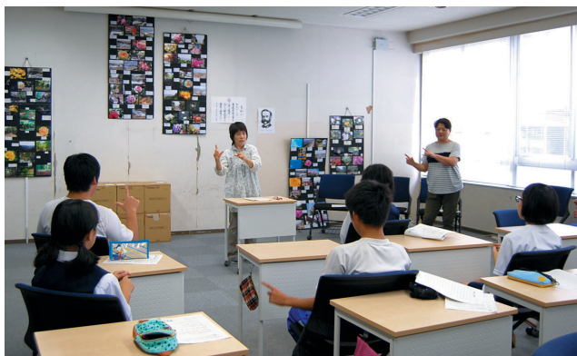
福祉教育の取り組み(中学校での授業)