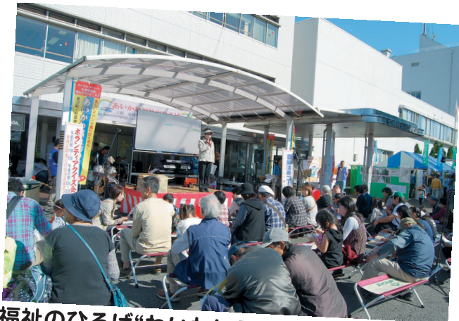
福祉のひろば“わいわいスペース”