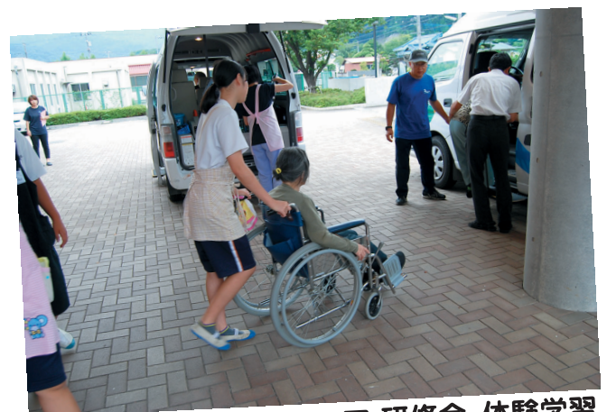
中・高生ボランティア 研修会・体験学習