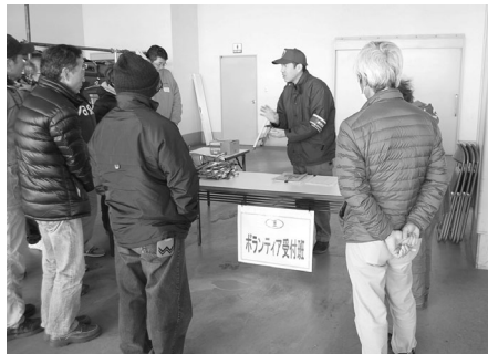
昨年度の災害ボランティアコーディネーター養成講座の様子

・中・高校生ボランティア研修会・体験学習 ・福祉教育サポーター養成講座 ・知的障がい児・者サポーター養成講座 ・災害ボランティアコーディネーター養成講座 ・男性ボランティア講座 ・災害ボランティアセンター設置運営訓練 ・各種災害ボランティアのネットワーク化の推進 ・(仮称)災害ボランティア交通費等助成事業