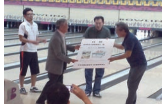
チャリティーボウリング大会にて

本協議会では、ミニデイサービスに通う高齢者のためのレクリエーション用具として活用します。ありがとうございました。