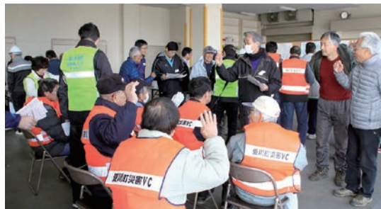
昨年の講座の様子