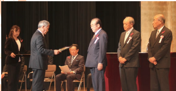
町社協会長から表彰状を贈呈

10月28日(土)、町文化会館ホールで「第36回愛川町社会福祉大会」を開催しました。(主催/愛川町・愛川町社会福祉協議会ほか)