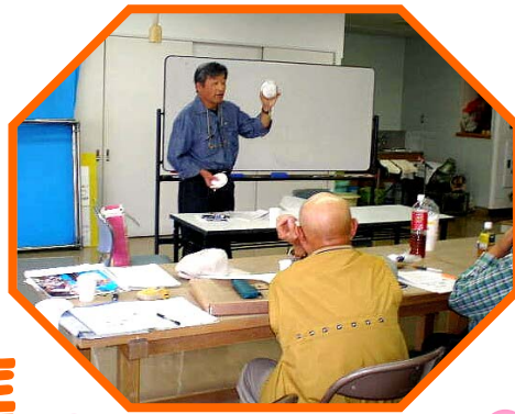
火災警報器の勉強会

定年後などに「なにか始めてみたい」と考える皆さん、自分も楽しみながら、ボランティアをしてみませんか。