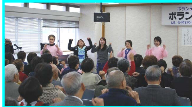
座ったままで出来るレクリエーション

全体会は、主催者の挨拶のあと、オリエンテーション、「座ったままで出来るレクリエーション」で心身を解放。そしてワークショップに移ります。今回は、町内にある高齢者サロン九つうちの六つのグループの代表による活動発表がありました。それぞれが手作りの食事会、お茶会、ゲーム等で、家に閉じこもりがちな高齢者の方たちのふれあいの場を作ることに心を砕いておられる様子が伝わりました。スタッフ(ボランティア)の高齢化