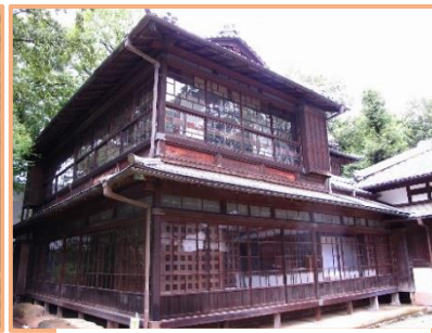
三井八郎右衛門邸