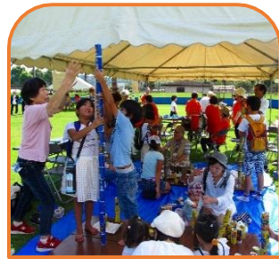
背たけより高く 缶積みゲーム