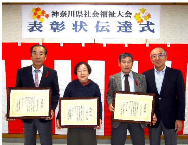
神奈川県社会福祉大会 受賞者 神奈川県社会福祉協議会会長感謝