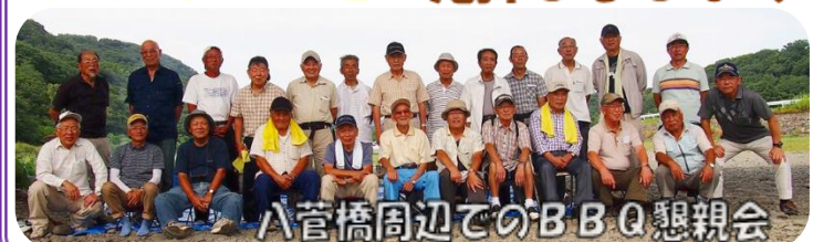
八管橋周辺でのBBQ懇親会