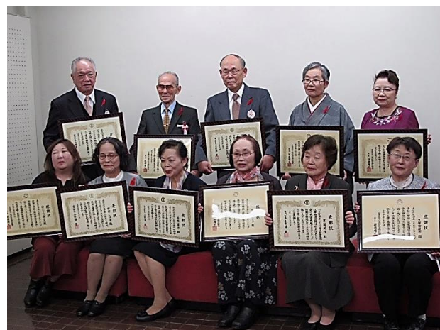
愛川町社会福祉大会 受賞者 福祉功労表彰・善行者感謝