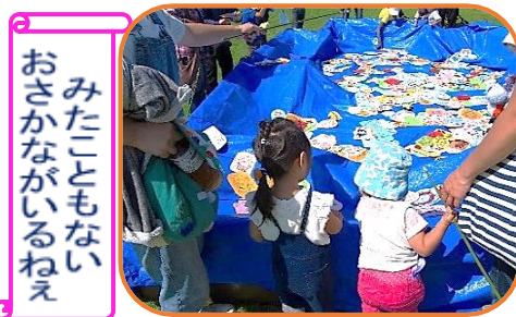
みたくもない おさかなが いるねえ